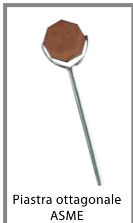
Piastra ottagonale ASME

Piastra ottagonale conforme alle specifiche ASME-ASTM- MIL-AMS, utilizzata il controllo della magnetizzazione, per la ricerca della direzione del campo magnetico, per verificare la qualità delle polveri magnetiche a secco e ad umido.