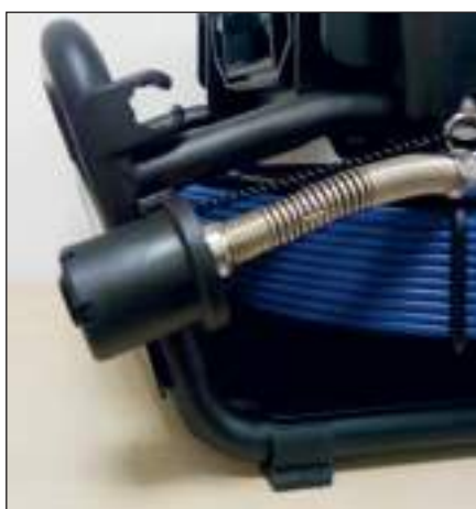
Protezione testa videocamera