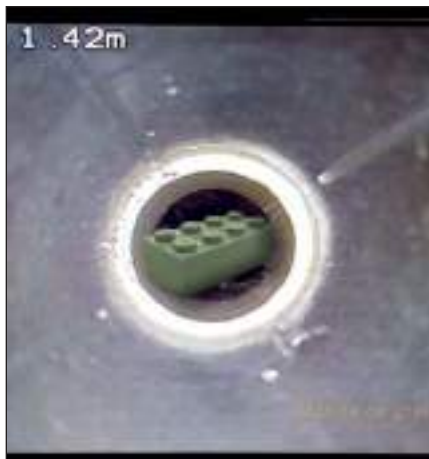
Contametri direttamente sul monitor