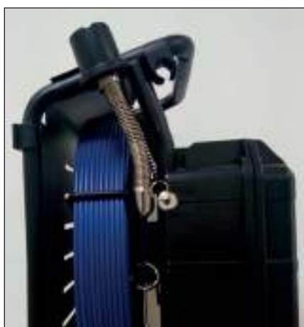
Maniglia di trasporto e protezione metallica antiurto