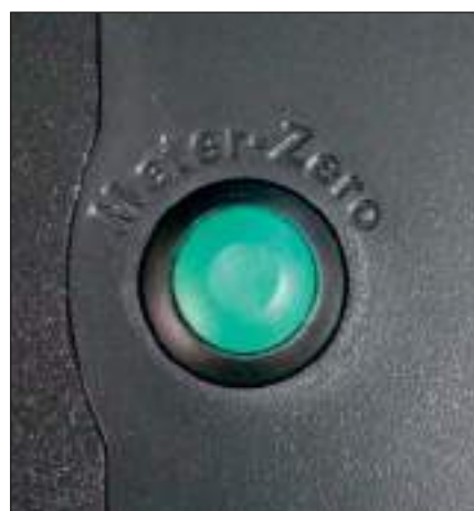
Tasto di azzeramento del contametri