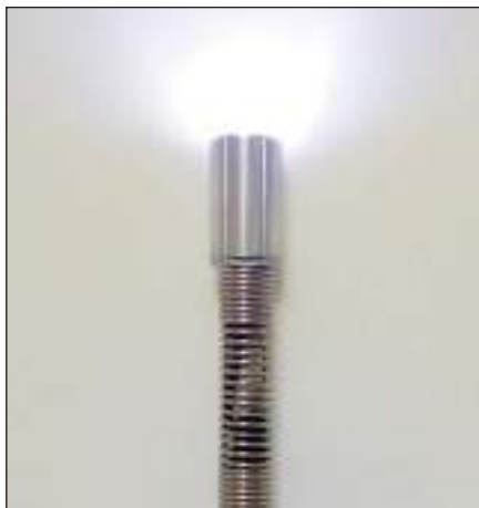
Testa videocamera a LED dimerabili a 4 livelli di potenza